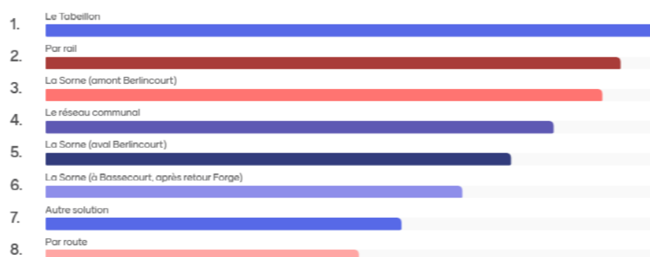
Figure 1 : Sondage réalisé en première partie de séance, juste après les cinq exposés introductifs, 21 personnes y ont participé